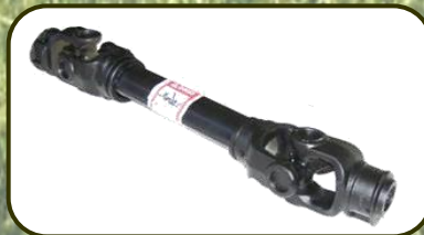
ยอຍนำเข้าจาก อิตาลี