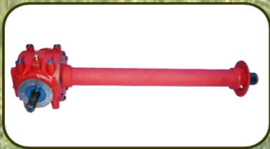
หัวเกียร์สำเร็จรูปนำเข้าจาก อิตาลี