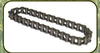
โซ่เบอร์ 24B (DIN8187) นำเข้าจากเยอรมัน