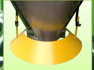
ชุดควบคุมระยะการหวาน

ใช้ได้ดีกับ ปุ๋ยเม็ด ปูนขาว ทราบ เมล็ดข้าว เมล็ดถั่ว เหมาะสำหรับปุ๋ยที่แห้ง และไม่มีกลิ่น