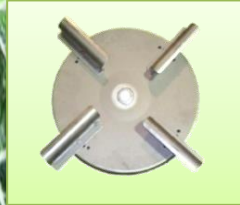
จานเหวี่ยงปุ๋ย ทำด้วยสแตนเลส