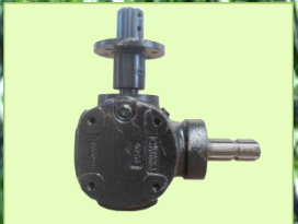
หัวเกียร์เหล็กหล่อ