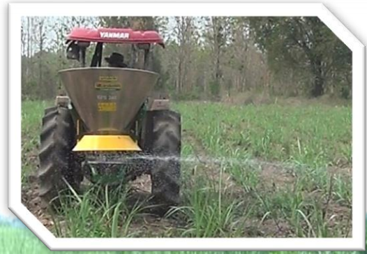
หวานปุ๋ยเคมีแบบเม็ดไปทางด้านขวา โดยไม่ต้องใช้อุปกรณ์เสริม