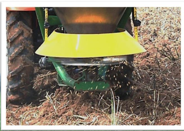
หวานข้าวแห้ง