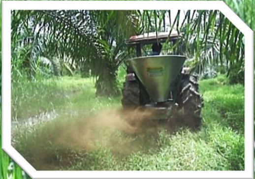
หวานซี้ด้างควาพ่นไปทางด้านซ้าย โดยไม่ต้องใช้อุปกรณ์เสริม