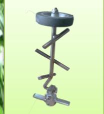
ชุดกวนปุ๋ยในถังป้องกันไม่ให้ ปุ๋ยจับตัวทำด้วยสแตนเลส