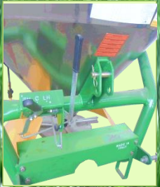
คันโยกปรับปุ๋ยและทิศทางการหว่าน