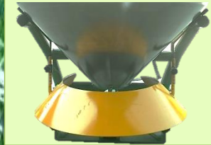
ชุดควบคุมระยะการหว่าน

ใช้ได้ดีกับ ปุ๋ยเม็ด ปุ๋ยขาว ทราบ เมล็ดข้าว เมล็ดถั่ว เหมาะสำหรับปุ๋ยที่แห้ง และไม่มี ความชื้น