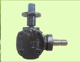
หัวเกียร์เหล็กหล่อ