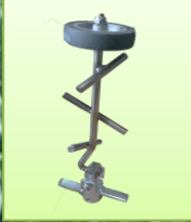
ชุดกวนปุ๋ยในถังป้องกันไม่ให้ ปุ๋ยจับตัวทำด้วยสแตนเลส