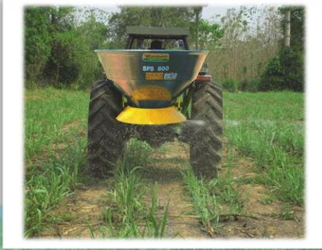
หว่านปุ๋ยเคมีแบบเม็ดไปทางด้านขวา โดยไม่ต้องใช้อุปกรณ์เสริม