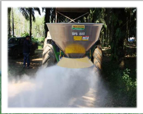
หว่านปุ๋ยโดโลไมท์