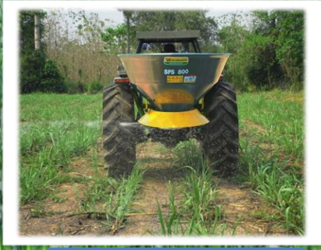
หว่านปุ๋ยเคมีแบบเม็ดไปทางด้านซ้าย โดยไม่ต้องใช้อุปกรณ์เสริม