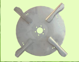
จานเหวี่ยงปุ๋ยทำด้วยสแตนเลส