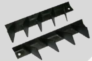
ลูกต้ออกแบบพิเศษ ไม่กินแรง