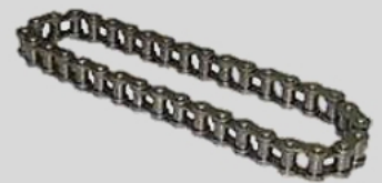
โซ่เบอร์ 20B (DIN8187)