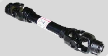
ยอยนำเข้าจาก อิตาลี