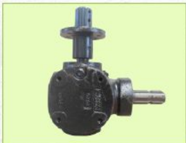
หัวเกียร์เหล็กหล่อ แข็งแรง ทนทาน