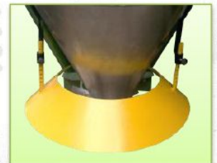
ชุดควบคุมระยะการหว่าน

ใช้ได้ดีกับ ปุ๋ยเม็ด ปุ๋ยขาว ทราย เมล็ดข้าว เมล็ดถั่ว เหมาะสำหรับปุ๋ยที่แห้ง และไม่มีควมชื้น