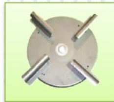
จานหว่านปุ๋ย ทำด้วยสแตนเลส