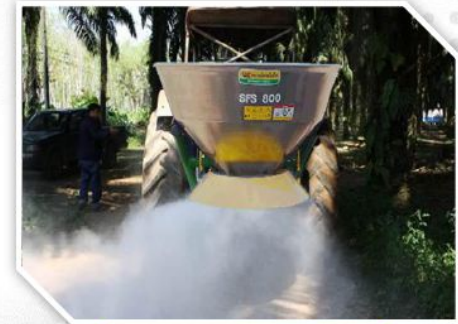
หว่านปุ๋ยโดโลไมท์