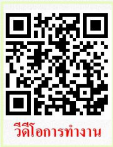
วิดีโอการทำงาน