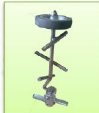
ชุดกวนปุ๋ยทำด้วยสแตนเลส ช่วยให้ปุ๋ยไหลออกได้ดี