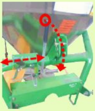
คันโยกปรับปุ๋ยและทิศทางการหว่าน