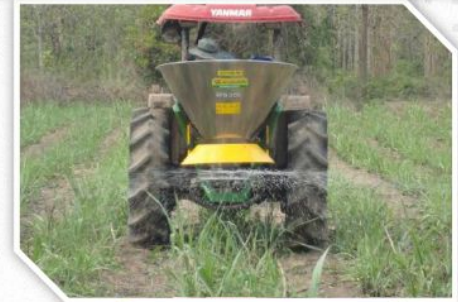
หว่านปุ๋ยเคมีชนิดเม็ด